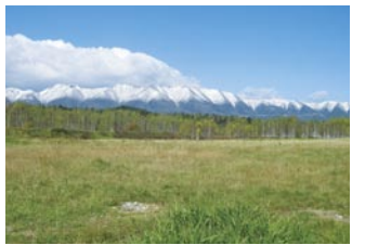
從十勝三股望向石狩連峰

十勝川流域內,東大雪的山與山裡寧靜的然別湖與雖是人造湖但景觀十分優美的糠平湖,以及被樹林包圍的十勝參膠等,擁有獨特魅力的深山一帶。另外,石狩連峰同時也是與表大雪區域相異的構造山地。而 Tomuraushi 山東麓則是十勝川源流原生自然環境保全地域。