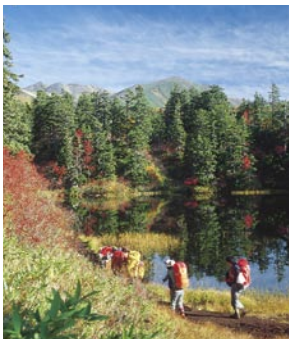
高原溫泉的登山客

這個時期有車輛進入的限制所以需要事前確認。從層雲峽到高原溫泉有公車行駛。步道入口處有棕熊情報中心，一定要受過解說才能出發。有棕熊相遇的危險時期，也有可能封閉步道。