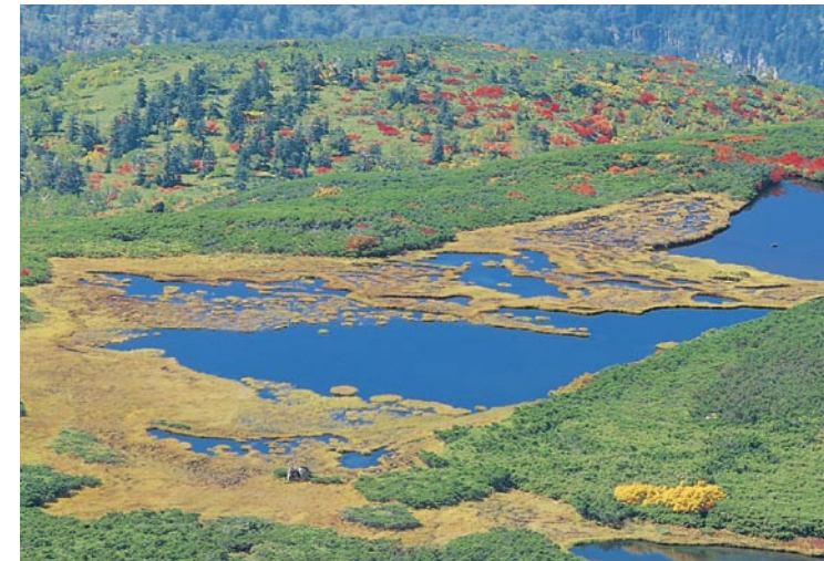
從當麻乘越見到的沼之平

從位於旭岳溫泉北方的愛山溪溫泉開始爬登。愛別岳山腹的廣闊寧靜的濕原中，池塘很優美。有越過當麻乘越到裾合平的路線。