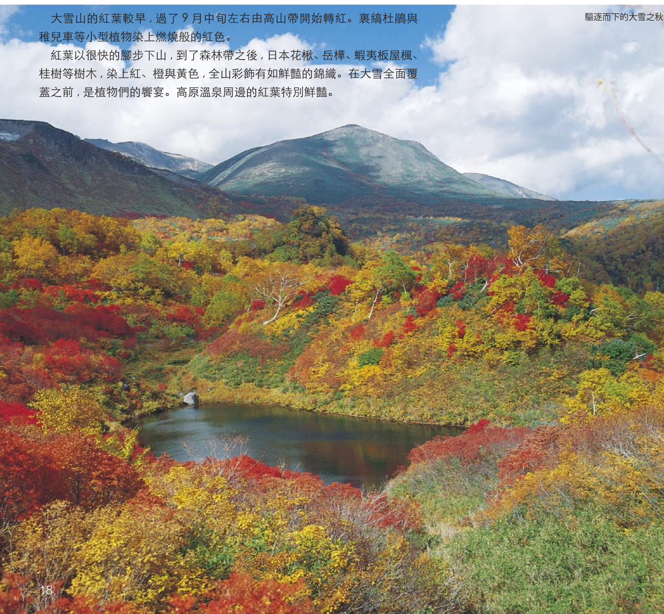
驅逐而下的大雪之秋

紅葉以很快的腳步下山，到了森林帶之後，日本花楸、岳樺、蝦夷板屋楓、桂樹等樹木，染上紅、橙與黃色，全山彩飾有如鮮豔的錦織。在大雪全面覆蓋之前，是植物們的饗宴。高原溫泉周邊的紅葉特別鮮豔。