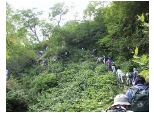
從愛山溪到沼之平

從位於旭岳溫泉北方的愛山溪溫泉開始爬登。愛別岳山腹的廣闊寧靜的濕原中，池塘很優美。有越過當麻乘越到裾合平的路線。