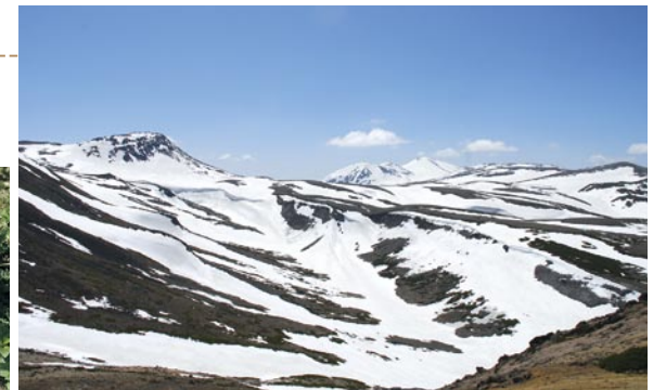
從赤岳山頂望向旭岳方面