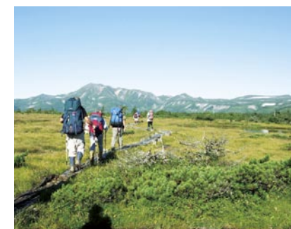
從沼之原到 Tomuraushi 山

這個區域當日來回的登山較為無理，只能利用避難小屋或自備帳棚。含十勝連峰等的大雪山地區裡，並沒有像日本阿爾卑斯山脈般設備完備的山小屋。黑岳石室與白雲岳避難小屋僅在夏季有管理人，其他在旭岳石室、忠別岳、Hisago 沼等的避難小屋都是無人管理。此外，在指定地以外禁止搭建帳棚露營，登山時先向各地的遊客中心等處詢問，取得最新資訊之後，謹慎擬定計畫為佳。主要路線在無雪期時並不是需要技術的且困難的路線，但距離較長，是屬於高難度者的路線。