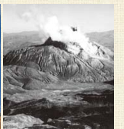
誕生10年後的昭和新山(1954年)