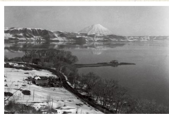
洞爺湖畔 珍古島付近 (1954 年)

打開洞爺湖畔觀光事業之路是在，大正時代 (1912~1926) 初期發現溫泉，末期通過本地的連結函館與札幌的國鐵室蘭本線與千歲線開始行駛之後。1929 年從虻田 (現 JR 洞爺) 車站到洞爺湖畔的鐵路 (第二次世界大戰中廢止) 開通之後，飯店以及高爾夫球場也開始進駐。關於國立公園的指定，戰前雖被列為候補地但卻是阿寒與大雪山先被指定為國立公園。但是在戰後由於鄰近札幌其利用性優良得到很好的評價，所以在 1949 年指定成國立公園。而且在 1955 年到 1973 年之間，高度經濟成長時的流行觀光旅行潮流，同時將洞爺湖畔發展成為一知名觀光景點。