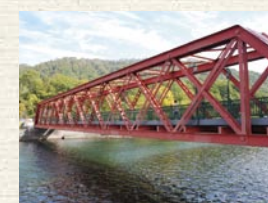
千歲市指定為文化財產的山線鐵橋

1972 年所舉辦的札幌冬季奧運中，惠庭岳是滑雪滑降競技的會場。為了競賽路徑的設置，必須砍伐國立公園內的樹木一事引起爭議，最後決議在競賽後將所有設施撤去，種植樹木恢復元來的狀態為條件，建設了全長 2 公里多的男女競賽路徑之外，纜車以及建築物等。競賽結束後立刻開始進行原狀回復的工作，到 1974 年為止實施了設施的撤去，植樹以及急斜面的治山工事。而且之後花費相當長時間進行維護作業。現在，競賽路徑的痕跡已經非常微薄，所栽植的樹木與周邊的樹木相比仍然還小。