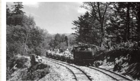
過去在美笛金山的專用鐵路 (1936 至 1951 年運轉)

雖然支笏湖周邊殘留著自然性高的森林，但在指定為國立公園以前，仍有著鑛山開發等產業活動的歷史。國土狹小的日本在指定國立公園之際，各地與鑛業、發電等產業之間的調整有很多且大的課題。日本的國立公園制度，自創設當時以來，經歷過在與許多產業之間相互調整，同時進行各種建設。