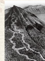
札幌冬季奧運時的惠庭岳滑雪滑降競賽路徑