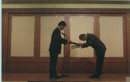
大賞受賞 帯広松下電工(株)