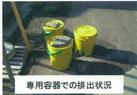
専用容器での排出状況