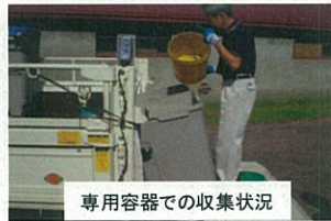
専用容器での収集状況