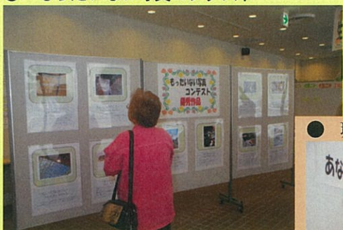
● もったいない写真コンテスト