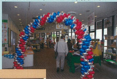
● 市民&キッズの3R交流ひろば