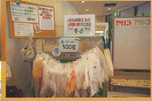
● ごみを減らして温暖化ストップ展示