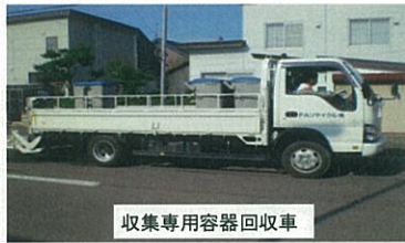
収集専用容器回収車

している。家庭から出される生ごみは有料化されても無料。人口1万二千人弱のこの都市は高齢化率が40%になっているが、老人世帯でも市のやり方を歓迎している。市にとってのうれしい効果はカラスがいなくなったことや、ごみ処分場に現れたクマやキツネが出なくなったという環境の改善のほかにも地域の農業や経済の活性化をあげていた。