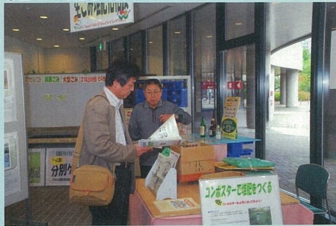
● 生ごみ堆肥化相談