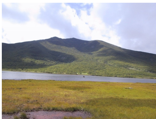
羅臼湖と知西別岳