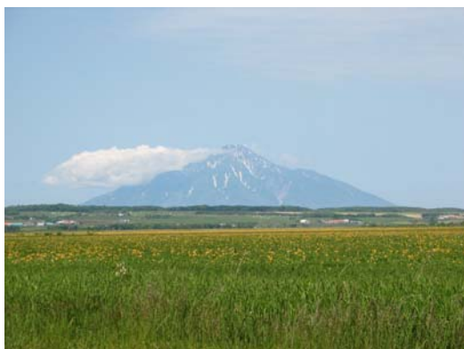
豊富園地より利尻島