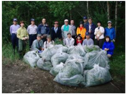
パークボランティアと清掃活動(支笏湖)