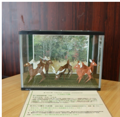
折り紙による自然の紹介(稚内)