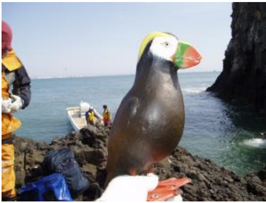
デコイの設置 (釧路:大黒島鳥獣保護区)