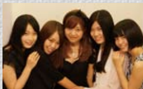
札幌ご当地アイドル ルミナリア

身近な日用品や衣服の再利用することが“カッコいい”“かわいい”くなる方法を企業・団体の事例をもとに、ご当地アイドル ルミナリアと一緒にトークセッションを行います。